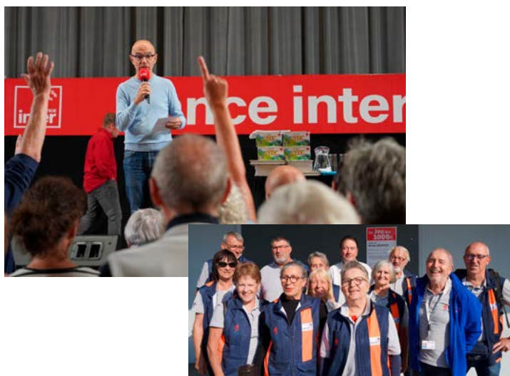
Mercredi 1 er octobre : Le Jeu des 1000 € de France Inter s'installe dans la cité olympique le temps d'une soirée.