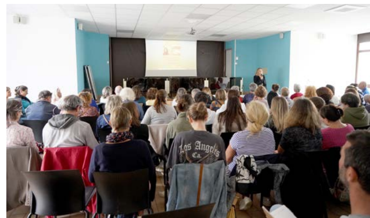
Vendredi 10 octobre : Un public éclectique a assisté à la conférence sur la gestion des émotions proposée par le Centre socioculturel.