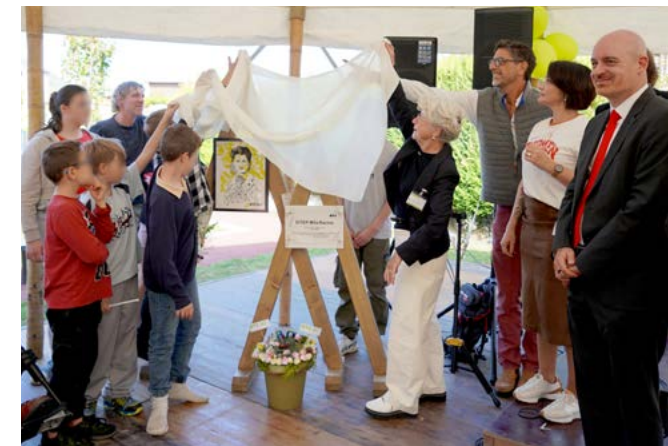
Mercredi 8 octobre : La fondation OVE fêtait ses 80 ans d'existence, l'occasion de mettre en lumière le dispositif ITEP d'Albertville "Mila Racine".