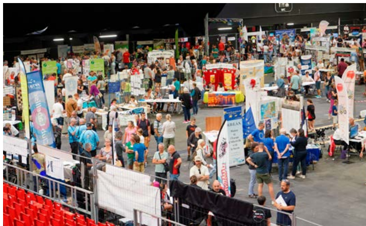
Samedi 6 septembre : Le forum des associations mettait à l'honneur les associations engagées dans le domaine de la solidarité : le Secours Populaire, le Secours Catholique, la Confédération Syndicale des Familles, les Restos du Cœur, Jusqu'à La Mort Accompagner la Vie et le CAPS.