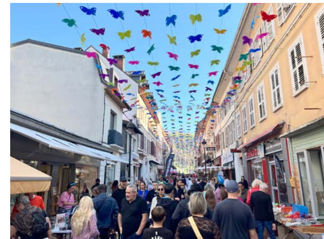
Samedi 12 octobre : Environ 500 particuliers et plus d'une centaine de professionnels ont exposé dans le centre-ville pour la nouvelle édition de la grande braderie d'automne.