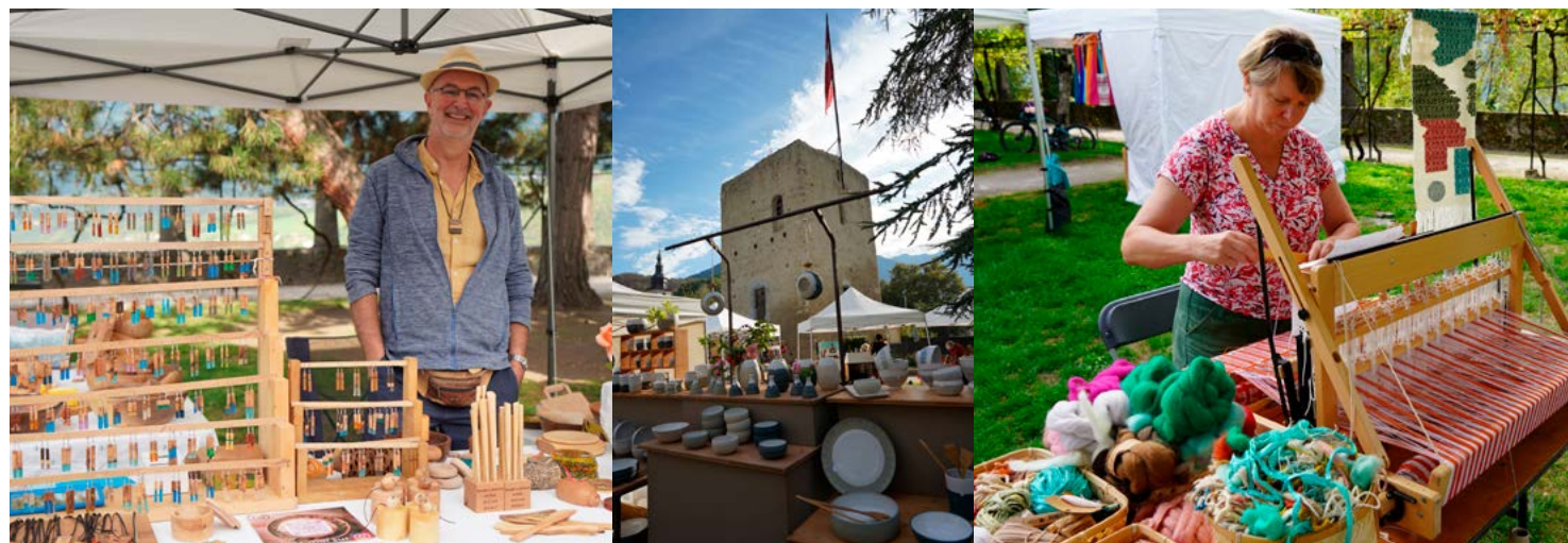
Dimanche 21 septembre : 2 e édition de Festiv'arts à Conflans avec ses démonstrations d'artisanat et son marché de créateurs.