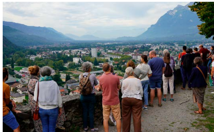
Samedi 20 et dimanche 21 septembre : Les visites des Journées Européennes du Patrimoine.