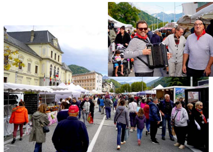
Samedi 4 octobre : Artisans et producteurs étaient au rendez-vous pour la foire d'automne.