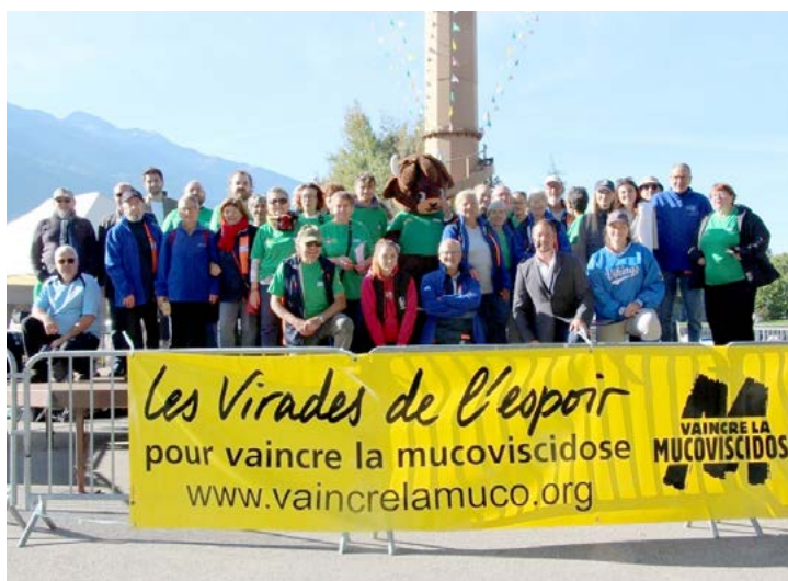
Dimanche 28 septembre : Ensemble contre la mucoviscidose pour les 40 ans des Virades de l'Espoir.