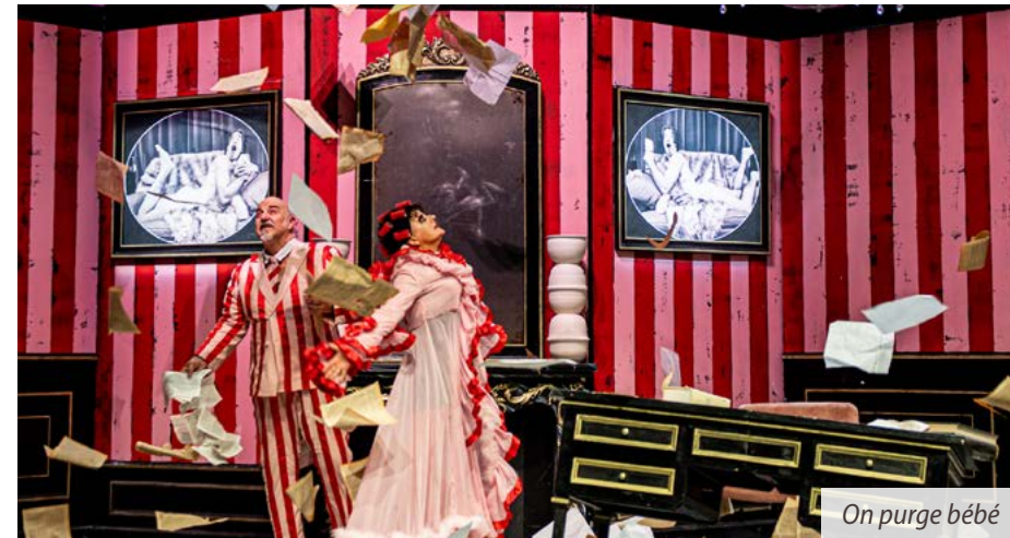
On purge bébé

En cette fin d'année, le Dôme Théâtre programme deux représentations en co-diffusion avec la Ville d'Albertville. On purge bébé et I'm Deranged présentent des univers singuliers sur deux thèmes différents.