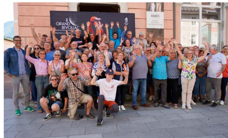
Du 13 au 19 octobre : Le Grand Bivouac : l'incontournable festival pour s'évader et réfléchir autour de films documentaires et de livres.